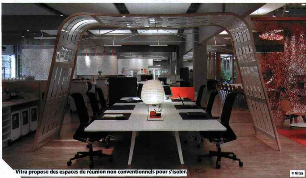
Vitra propose des espaces de réunion non conventionnels pour s'isoler.