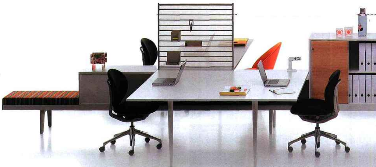
Level 34, élément clé du Net'n Nest. Son système de mobilier autonome allie design classique et modularité fonctionnelle.

sant des alternatives permettant de s'isoler. Cela profite aussi bien aux personnes qu'à l'organisation puisque nous devenons plus productifs par le choix de notre environnement. En outre, le bureau devient plus humain car il respecte le besoin naturel d'une sphère privée ».