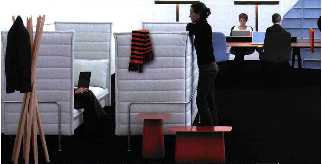
Net 'n' Nest : Design Ronan & Erwan Bouroullec.